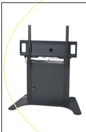
ST 100 freistehend