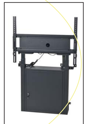
ST 100 Wandversion