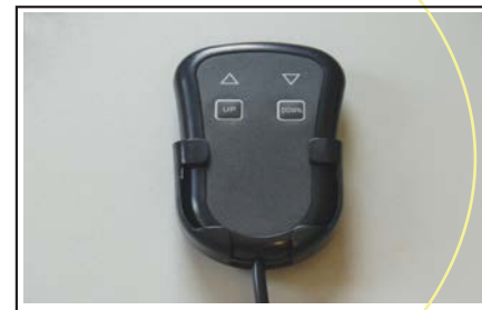
Žični daljinski upravljalac