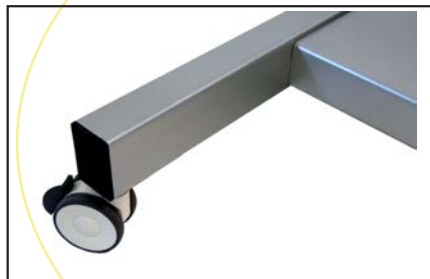
Štiri kolesa z zavoro